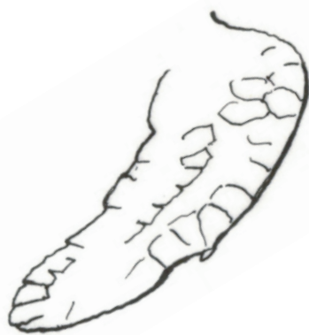
aleta de tortuga de mar