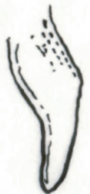
ala de pingüino