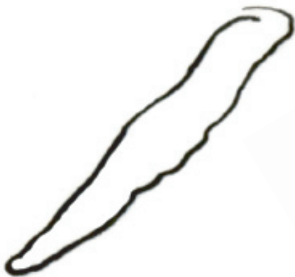
aleta de ballena

Estas "aletas" les ayudan a todos ellos a vivir en el agua.